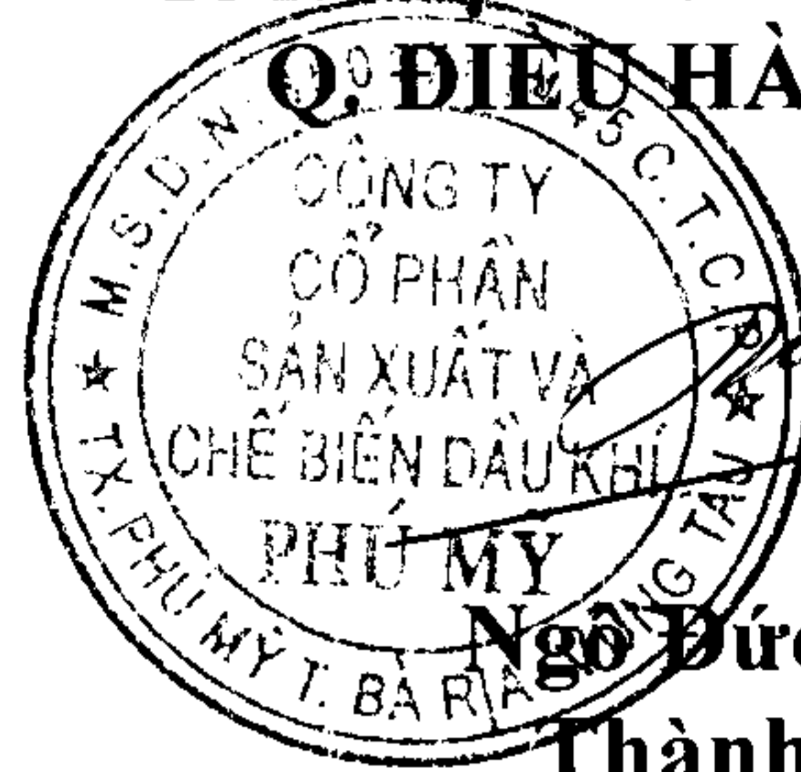
Ngô Đức Dũng Thành viên